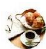
お茶やコーヒーに